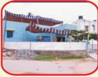
Community Hall Building