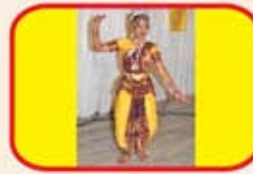
Reception Group Dance Programme