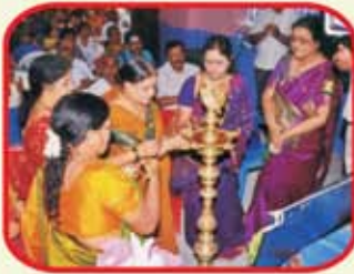
Lighting of Lamp