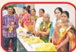
Office Bearers - Hosur Branch