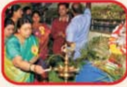
Lighting of Lamp