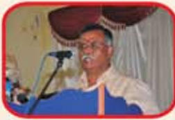
Welcome Speech by North Zone President