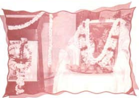
Ranaprathap Singhji Jayanthi Celebrations

27th Annual Day Celebration at Kovai Nagarathar Sangam A/c on 1-8-2010