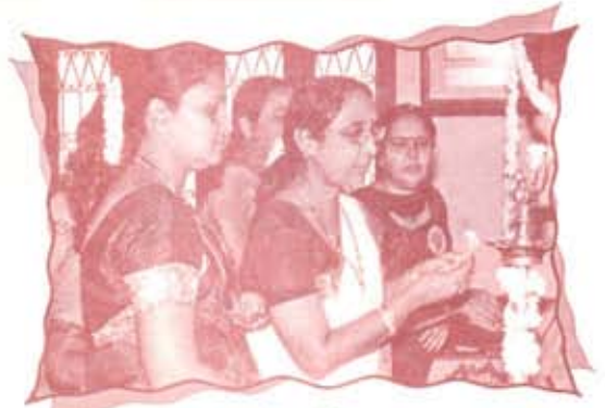
Lighting of Lamp