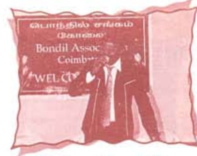
Sun TV Famous Asathapavathu Yaru PATTABI